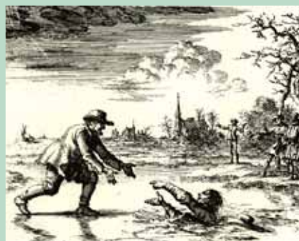
德·威廉士 [Dirk Willems]

门诺会逐渐成为市区的, 多元文化的, 適切社区及其需要, 并且致力带出基督教的景象, 那就是信仰与行为交织, 表里一致的全备信仰表达.