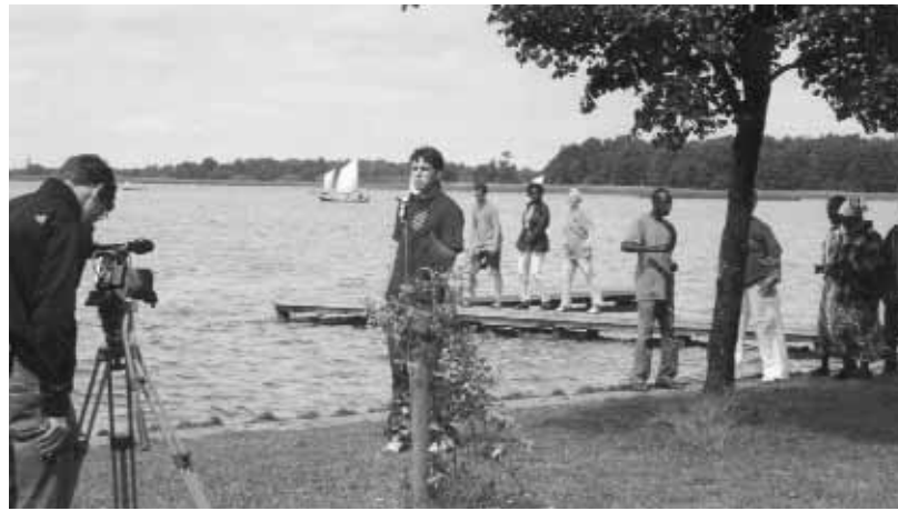
Juventud de Holanda y Tanzania trabaja en un video que se mostrará en la TV nacional de sus respectivos países.

En la segunda semana, el grupo preparó un video en la aldea de Giethoorn, que se conoce como la “Venecia Holandesa” por sus muchos canales. Con la canción del título “We have a dream” (Tenemos un sueño) el video habla del programa “Ya no somos extranjeros” y trata el tema de los sueños, como lo hizo Martin Luther King en el mensaje que pronunció en Washington, D.C., EE.UU., en 1963. “Este discurso fue muy poderoso y significativo para los jóvenes de todo el mundo, y podemos aprender del mismo como comunidad