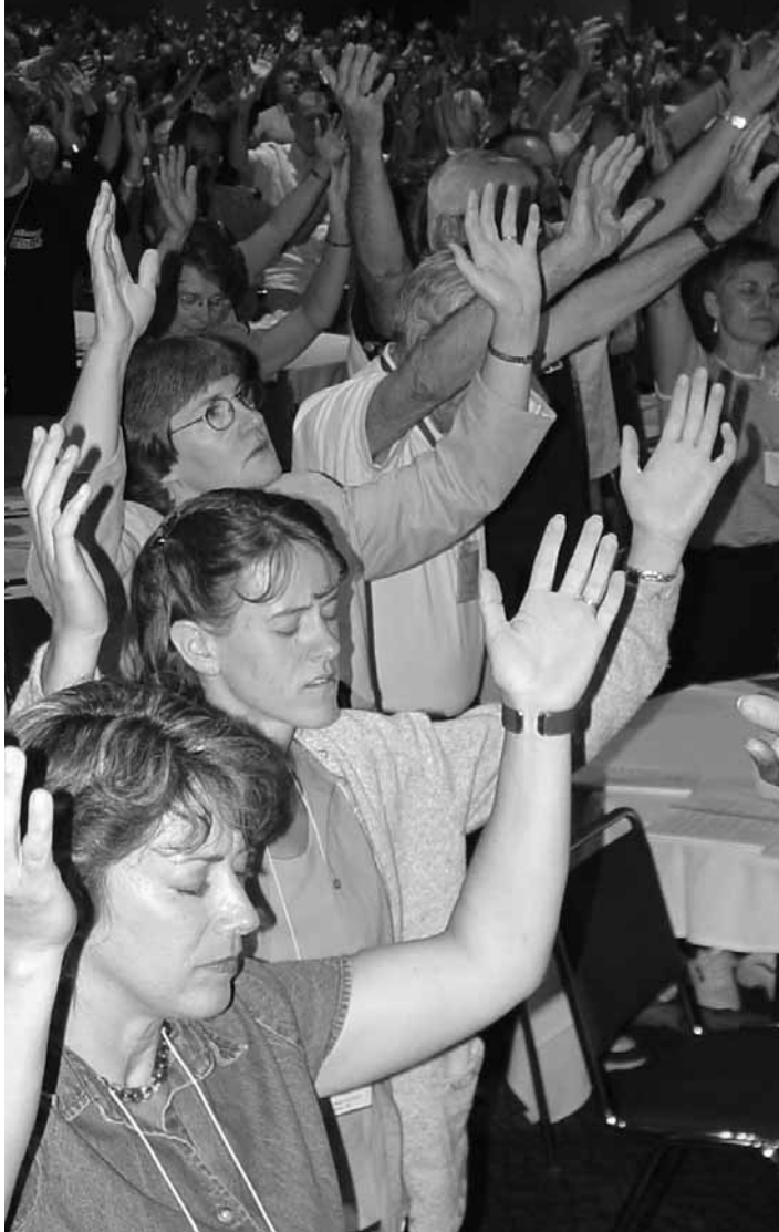
La convención unida de la Iglesia Menonita Canadá y la Iglesia Menonita USA, realizada en julio, incluyó cultos de alabanza para adultos (arriba) y para jóvenes —y también un culto unido.