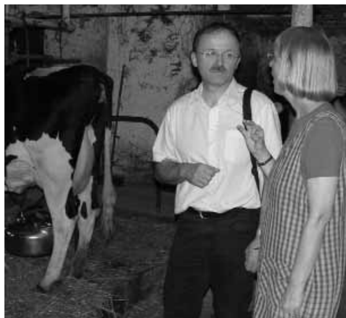
2005 Trimestres 3 & 4