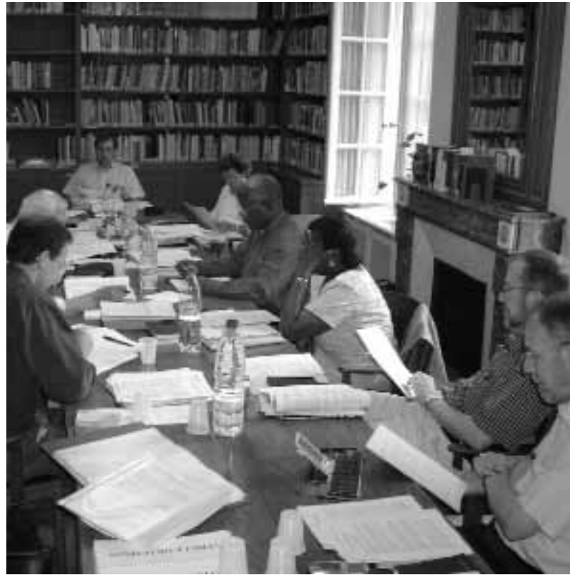
La Comisión Internacional de Estudio Luterano-Menonita discute en su primera reunión en Estrasburgo, Francia, en julio pasado.